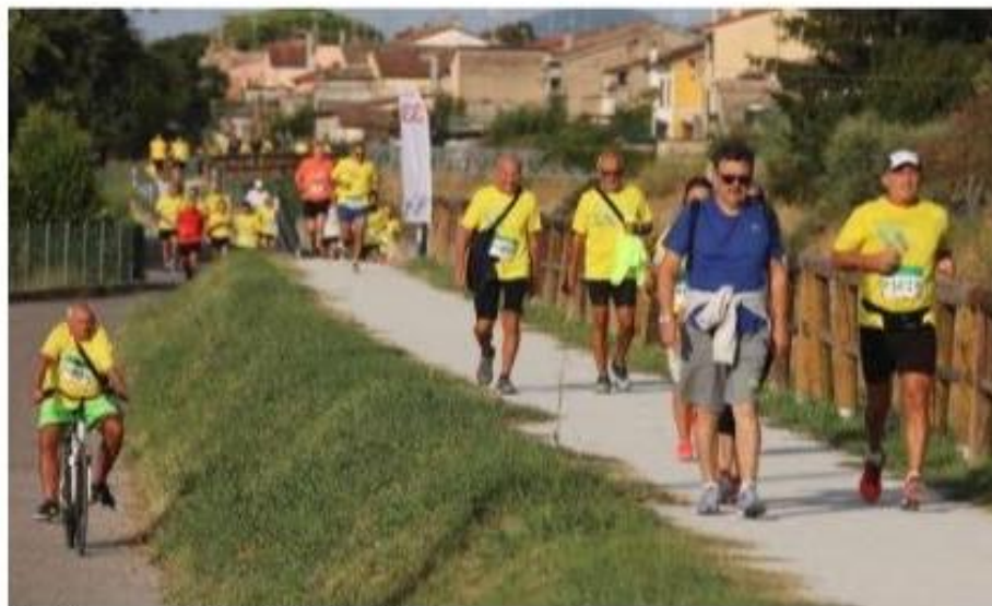
Una delle scorse edizioni della Maratona Alzheimer

Tra gli intenti della Fondazione c'è quello di «incrementare in maniera considerevole il numero delle "città amiche delle persone con demenza" in Italia, mediante contributi finalizzati allo start-up di nuove esperienze. Lo scopo della Fondazione, condiviso e accolto dagli associati, è quello di promuovere una nuova cultura per l'affermazione