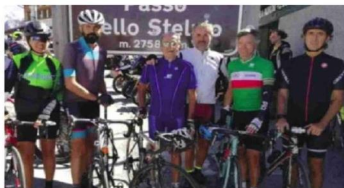
Romano Prodi domenica al passo dello Stelvio