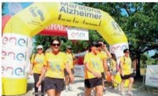
Partecipanti all'edizione 2020 della Maratona Alzheimer

Dall'11 al 13 settembre si è poi svolta a Cesenatico una tre giorni con più di 1.500 persone e in contemporanea, alla colonia Agip, si è svolto l'Alzheimer Fest, che ha visto performance artistiche, incontri, mostre e spettacoli susseguirsi nel corso del week-end, coinvolgendo associazioni e famiglie che convivono quotidianamente con la malattia. Instancabili i 300 volontari che si sono alternati. La Maratona Alzheimer, con la sua formula virtuale, si è prolungata fino al 21 settembre e ha consentito a 1.200 persone, anche da luoghi lontanissimi come Dubai a Taiwan, di unirsi