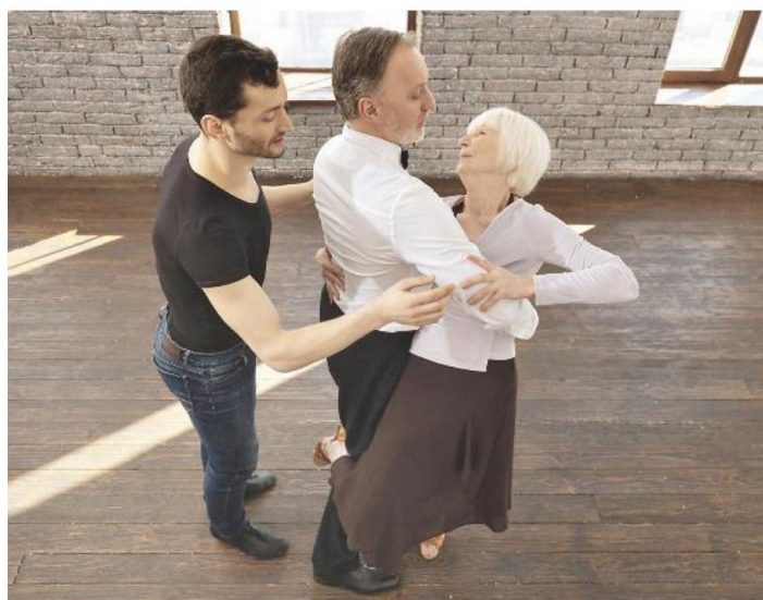
La tangoterapia si è dimostrata efficace per combattere Alzheimer e demenza

L'ASSISTENZA A CASA In un sondaggio il 50% dei parenti ha risposto di averci rimesso la salute