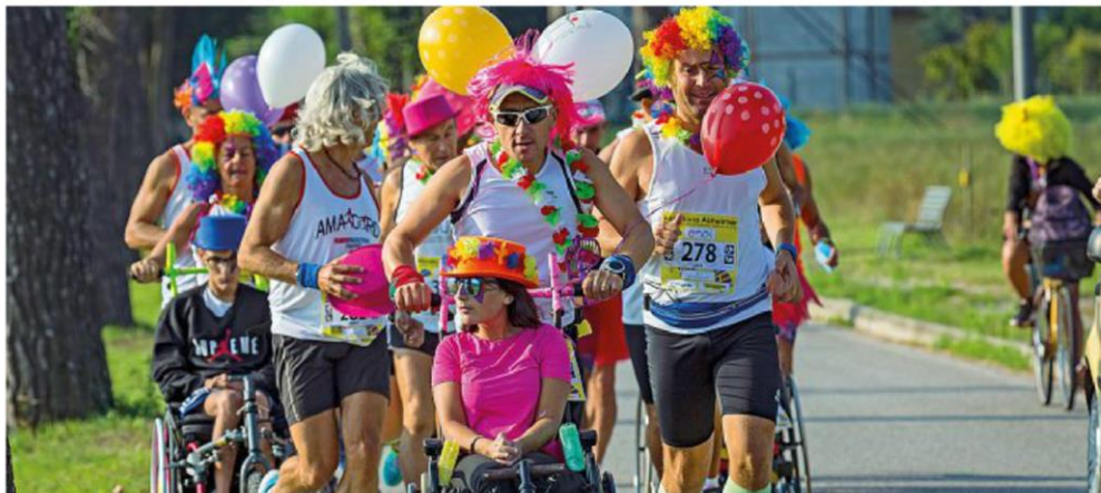
Un momento della corsa promossa da Fondazione Maratona Alzheimer per sensibilizzare sulla malattia