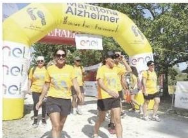
La Maratona Alzheimer ormai è un appuntamento consolidato

A partire dal 2012 la Maratona Alzheimer ha raccolto oltre 320mila euro destinandone un terzo alla ricerca. A Cesenatico,