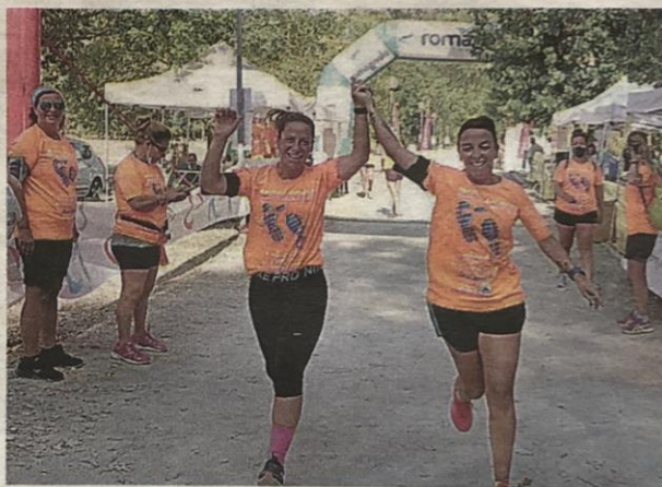
L'arrivo della podistica riservata alle donne

Gli appuntamenti di ieri hanno avuto inizio alle 9.30 con la Ban-