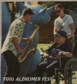
FOTO ALZHEIMER FEST

Quest'anno a Cesenatico, durante il week-end di Maratona Alzheimer, da venerdì 11 a domenica 13 settembre, approda l' Alzheimer Fest . Si propone con il titolo "La cura dopo la tempesta", con riferimento esplicito al Covid-19, e vuole offrire a tutti la possibilità di incontrarsi, essere se stessi, non sentirsi soli nelle difficoltà.