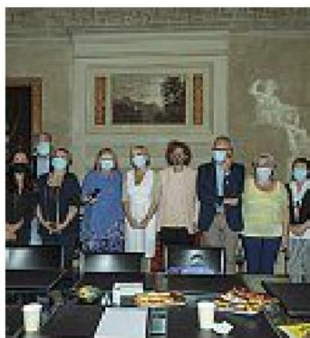
L'atto di costituzione

Una fondazione per unire e rappresentare tutte quelle forze che si occupano dell'Alzheimer e delle altre forme di demenza: con un atto formale siglato nello studio legale Costacreta di piazza di porta Ravegnana è nata la Fondazione Maratona Alzheimer, nuova realtà già in grado di convogliare associazioni ed enti verso la collaborazione e l'unico obiettivo di aiutare quel milione di persone che vivono con una demenza in Italia. Un'iniziativa che anticipa gli eventi previsti a Cesenatico dalla Maratona Alzheimer (arrivata alla nona edizione) e dall'Alzheimer Fest dall'11 al 13 settembre, con alcune attività che si prolungheranno fino al 21 settembre: a causa dell'emergenza sanitaria sono cambiate modalità di svolgimento ma dal mondo del terzo settore che si occupa di queste tematiche è arrivata la volontà di salvaguardare gli appuntamenti più importanti. Diritti, cura, prevenzione e soste-