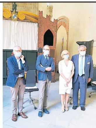
▲ La presentazione Ieri mattina nel cortile d'onore di Palazzo d'Accursio il battesimo della Fondazione