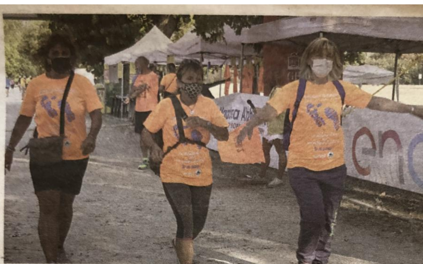
L'ultima edizione della Maratona Alzheimer