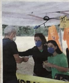
Alcuni partecipanti e volontarie della versione riveduta della "Maratona Alzheimer", che ieri ha avuto il suo momento clou al parco di Levante