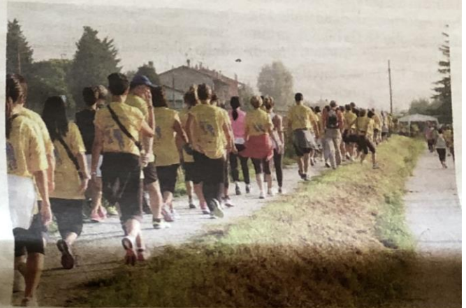
I camminatori di una precedente edizione

La decisione degli organizzatori di sospendere le gare competitive risulta presa per diverse motivazioni: «Ad oggi non sono ancora state pubblicate linee guida dalla Fidal per la realizzazione degli eventi podistici e non ci sono indicazioni ufficiali dal Ministero dello Sport. Maratona Alzheimer è il frutto di tanti mesi di lavoro: anche se ci fosse data oggi la conferma che nel mese di settembre avremo la possibilità di svolgere