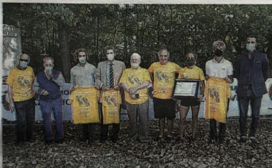
La consegna della targa del Panathlon avvenuta ieri al Parco di Levante

Tanti i chilometri percorsi, di corsa o in cammino, per sostenere i diritti delle persone con demenza. Anche ieri c'è stato un programma denso di iniziative nel Parco di Levante di Cesenatico. Ieri mattina alle 9,30 il via con il concerto della Banda degli Ottoni del Conservatorio Bruno Maderna e l'apertura ufficiale della giornata alla presen-