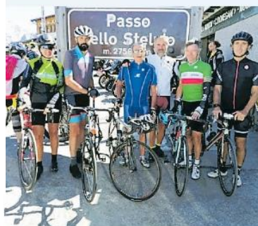
▲ Il gruppo Prodi a 2.750 metri