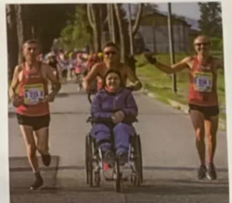
GRUPPO DI "SPINGITORI" A UN'EDIZIONE PRE-COVID DELLA MARATONA ALZHEIMER

approntate alcune modifiche. Sarà possibile parteciparvi attraverso due modalità: Percorso a Cesenatico oppure Maratona virtuale . Nel primo caso si tratta di un circuito di 8 chilometri, da percorrere di corsa o in cammino, da venerdì 11 a domenica 13 settembre, con partenze scaglionate solo su prenotazione. Il percorso attraverserà i Giardini al mare e la spiaggia in tutta sicurezza. Per la Maratona virtuale invece è possibile aderire da qualsiasi parte d'Italia o del mondo e percorrere, dall'11 al 21 settembre, Giornata mondiale Alzheimer, quanti più chilometri camminando, correndo o pedalando. Tutti i chilometri percorsi andranno ad aggiungersi ai 700mila già raggiunti dai partecipanti dalla prima edizione del 2012 della Maratona fino ad oggi. L'obiettivo è raggiungere il traguardo di un milione di chilometri, un milione, tante quante sono in Italia le persone affette da questa malattia. In entrambi i casi è possibile iscriversi online e procedere con la donazione