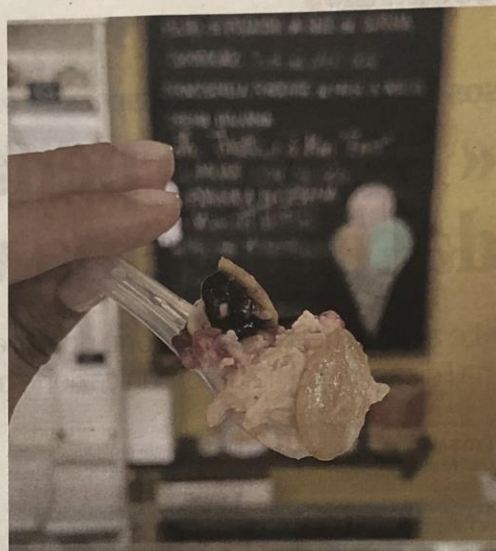
Il gusto è al pesto di nocciola e mandorle con farciture di mirtillo rosso e semi di zucca caramellati

geranno i chilometri percorsi di corsa, in cammino, o in bici; oppure si potrà percorrere un circuito di 8 km su Cesenatico con partenze scaglionate in sicurezza nel weekend dall'11 al 13 settembre. Tutte le modalità saranno utili per arrivare all'obiettivo di 1 milione di chilometri.